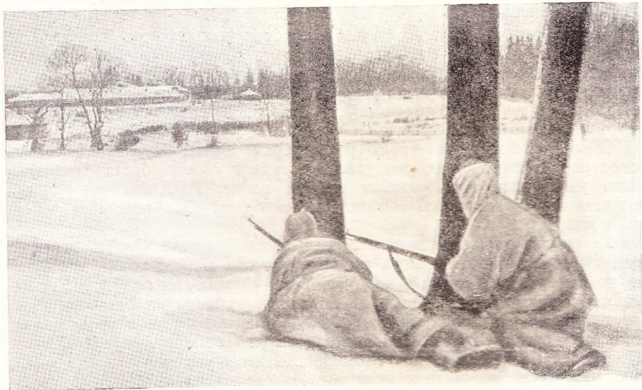
Вперед на запад! Советские разведчики у Ясной Поляны. Это последние часы хозяйничанья фашистских варваров в усадьбе, где жил и творил великий писатель Л. Н. Толстой.

Во время одного боя Зоя вынесла двадцать восемь бойцов. Она