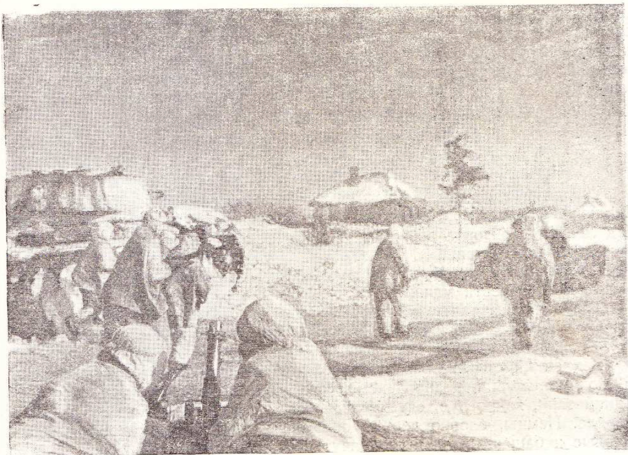
Еще один населенный пункт освобожден от фашистских захватчиков.