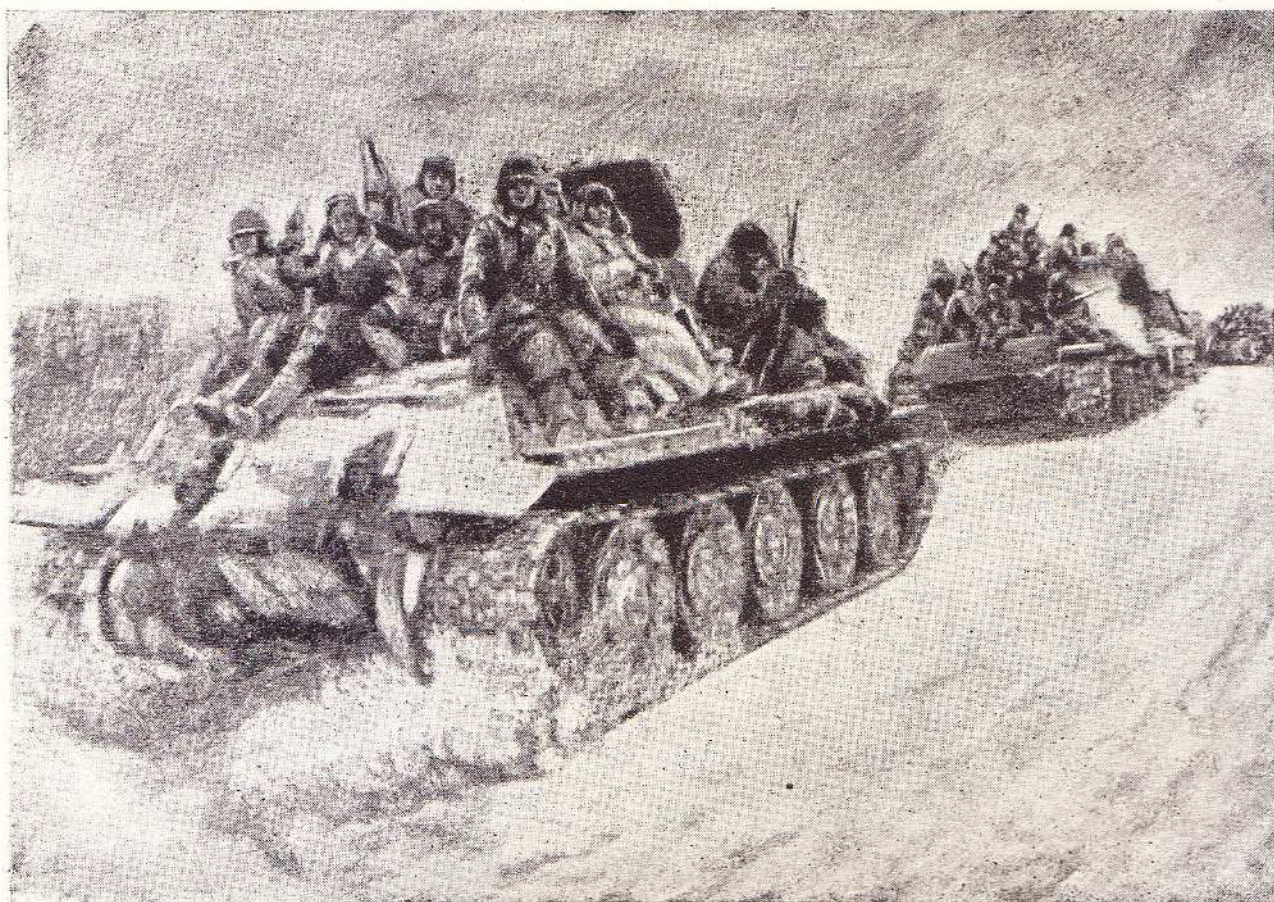
Танковый десант на боевом марше.