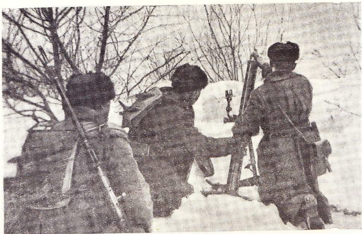
Отважный минометный расчет вплотную подобрался к вражеским позициям. Метким прицельным огнем минометчики расчищают путь наступающей пехоте.

Мы жили в одном палаточном городке. В ненастные дни вместе сушили над костром портянки и грели босые ноги. Мне особенно запомнился один курсант-выпускник, молодой еще, но бывалый человек, комсомолец. Он главенствовал у костра. Ломал и подкладывал прутья и этак неторопливо, по-крестьянски рассказывал, как он пошел на войну с белофиннами: