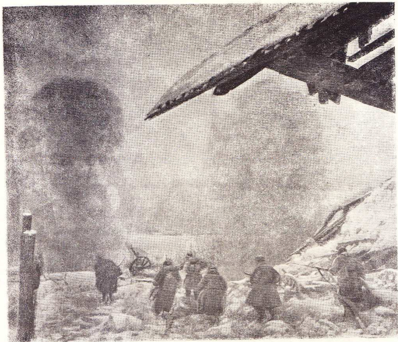
Бойцы Красной Армии ведут бой за населенный пункт.

бинокль улицы столицы. В своей стенгазете мы нарисовали Гитлера. Он сидит на снегу, поджавши ноги, держит у глаз вместо бинокля скрученные сводки Геббельса, а перед биноклем — огромный кукиш.