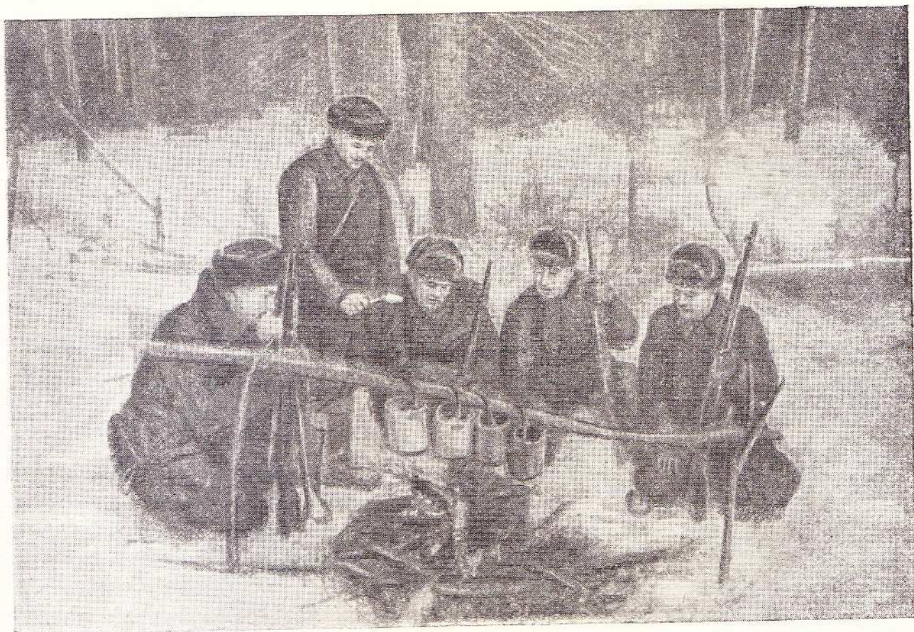
Партизаны на привале.

Здоровье постепенно восстанавливалось. Нога перестала ныть. Я стал себя чувствовать значительно бодрее.