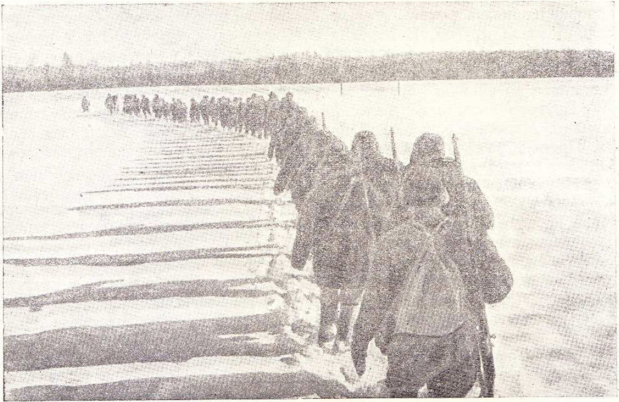
Во вражеский тыл!

— С левого фланга по одному отступать по намеченному маршруту. Илья, веди отряд!