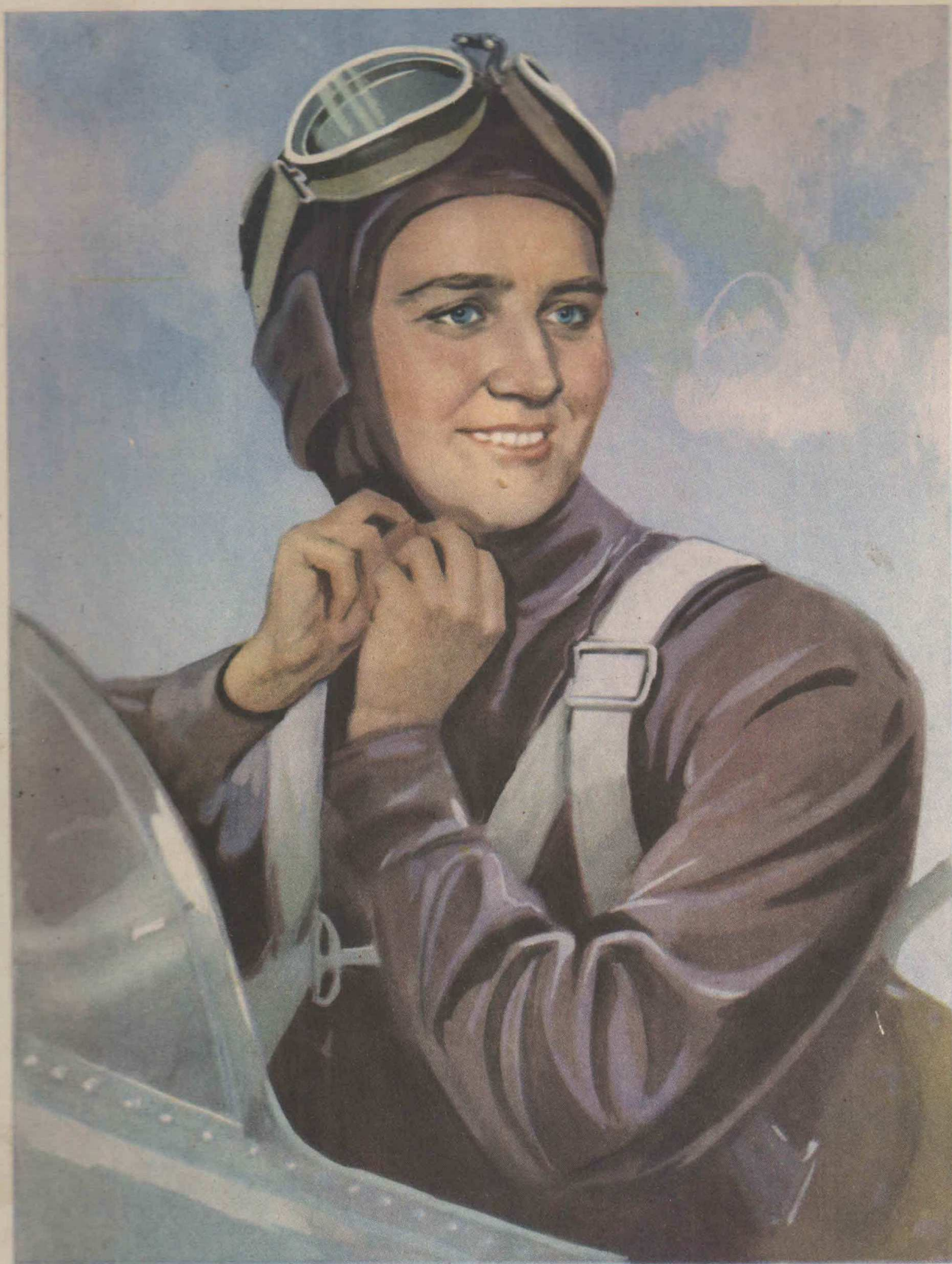
Герой Советского Союза РАСКОВА Марина Михайловна (1912—1943)

Майор, русская, член КПСС. В 1938 г. штурман М. Раскова вместе с В. Гризодубовой и П. Осипенко на самолете «Родина» совершила перелет Москва — Дальний Восток. Самолет из-за недостатка горючего не смог долететь до Комсомольска-на-Амуре. Выбросившись с парашютом, Раскова оказалась одна в тайге. Десять суток без пищи, не раз проваливаясь в болото, шла она до места посадки «Родины».