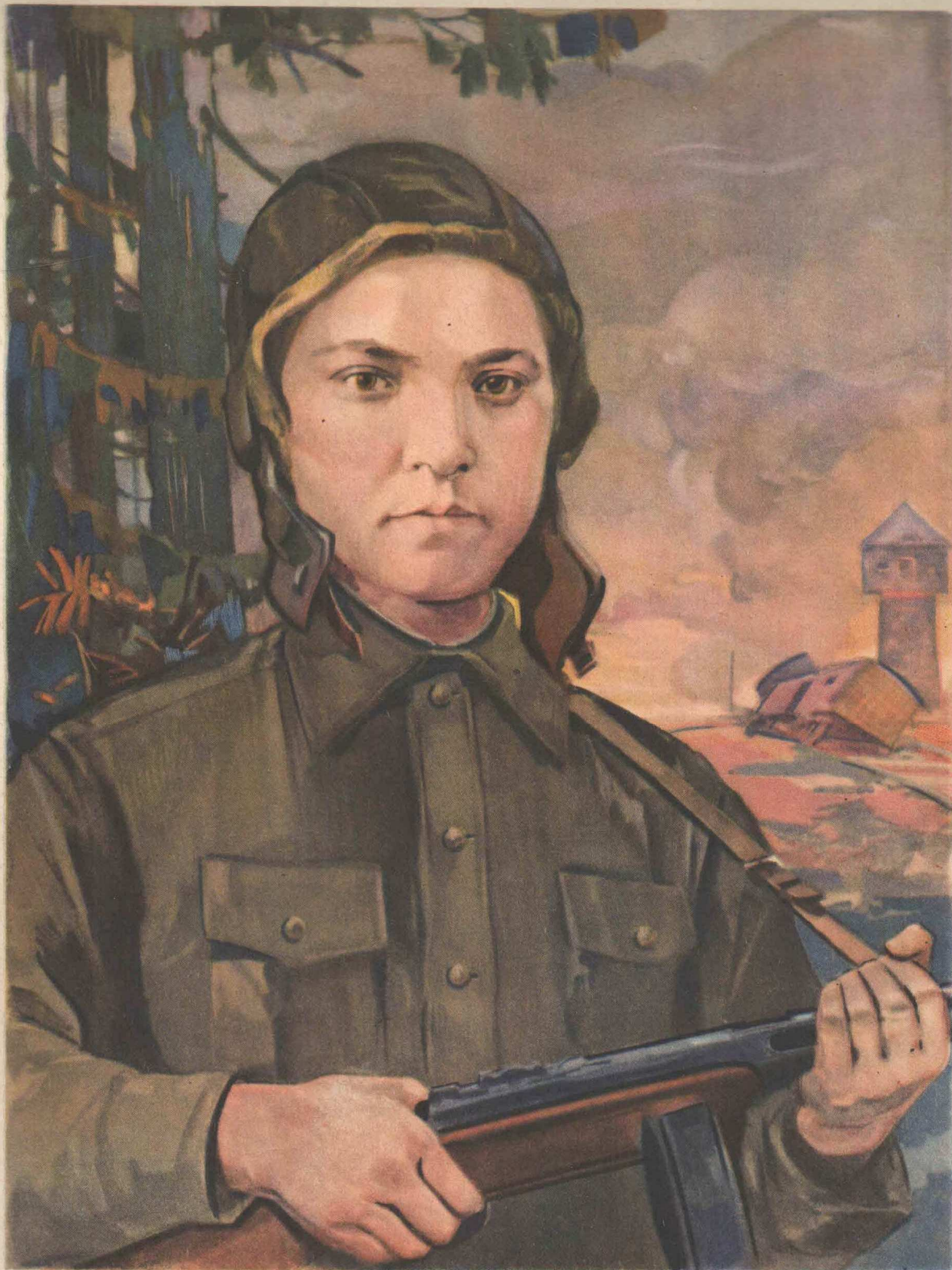
Герой Советского Союза КОЛЕСОВА Елена Федоровна (1920—1942)

По заданию ЦК ВЛКСМ русская девушка комсомолка Е. Ф. Колесова возглавила диверсионно-партизанскую группу парашютистов. В ночь под 1 мая 1942 г. на самолетах девушек перевезли и сбросили у д. Меговщина Борисовского района. Уже в первых числах мая партизанки подорвали мост, по которому неожиданно усилилось движение вражеских автомашин. Во всех операциях по уничтожению оккупантов и полицаяв Колесова принимала самое активное участие, она лично подрывала эшелоны с войсками и боевой техникой врага, проявляя при этом умение, выдержку и отвагу. За голову партизанки гитлеровцы обещали 30 000 марок, но она была неуловима. В сентябре 1942 г. Колесова участвовала в крупной операции по уничтожению оккупантов в районе д. Выдрецы. В боях с врагом она погибла смертью храбрых.