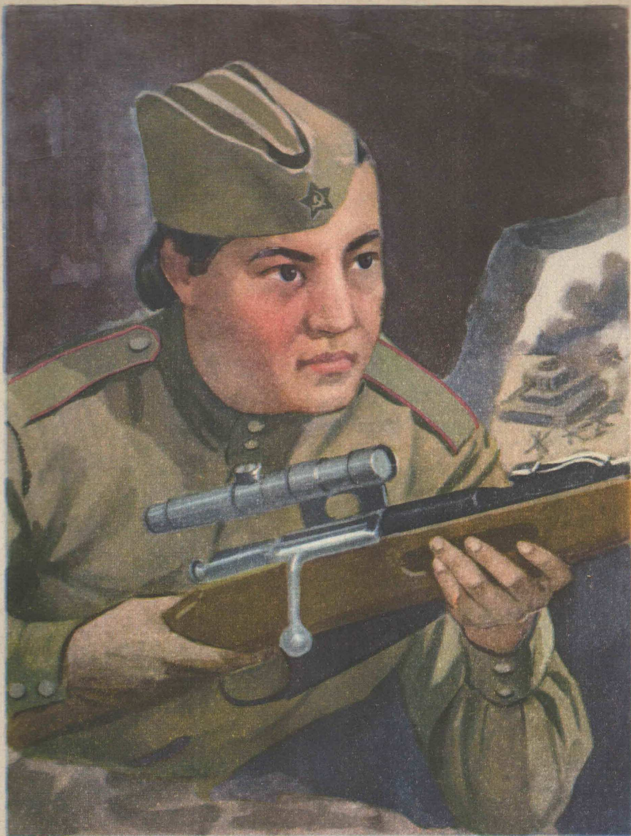
Герой Советского Союза МОЛДАГУЛОВА Алия Нурмухамбетовна (1925—1944)

Добровольно пошла на фронт. Все время находилась в боевых порядках подразделения, действовала вместе с наступающими войсками. В бою за д. Федорухново, когда выбыл из строя командир, комсомолка Молдагулова с призывом «Вперед! За Родину!» увлекла за собой подразделение, которое заняло важный узел обороны гитлеровцев. Девушка-снайпер при отражении вражеских атак истребила 28 фашистов.