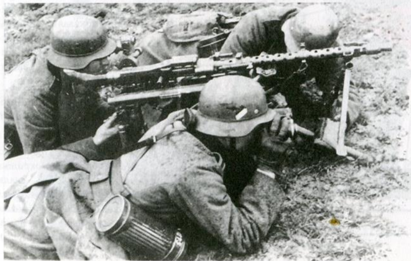
Вражеские пулеметчики ведут огонь