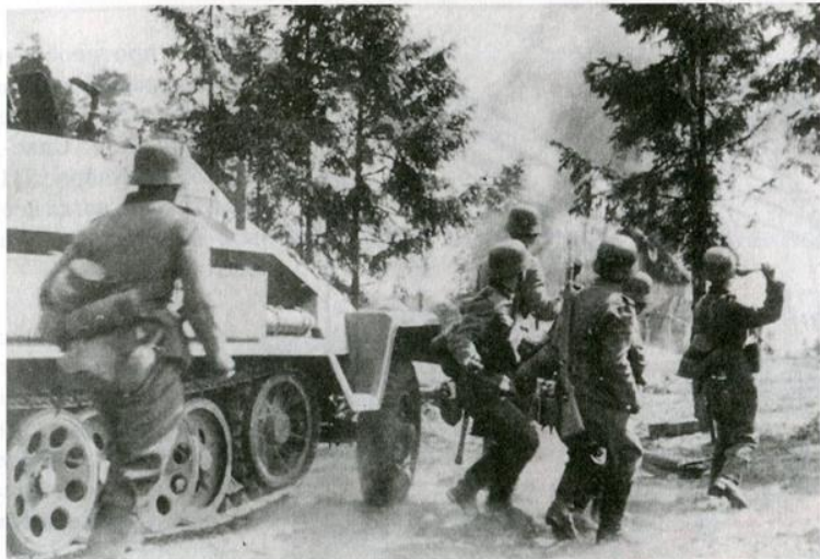
В бою немецкая мотопехота