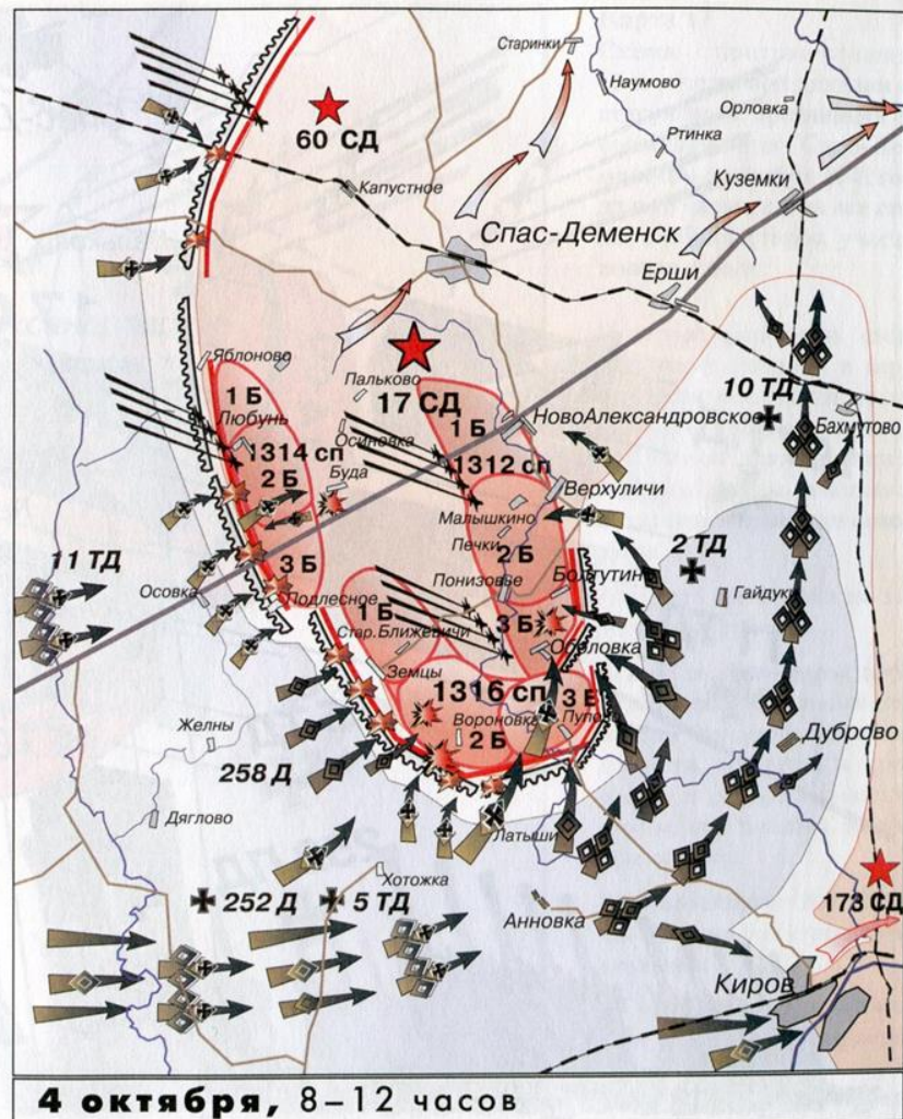
Карта 16 Боевые действия 17-й стрелковой дивизии под Спас-Деменском