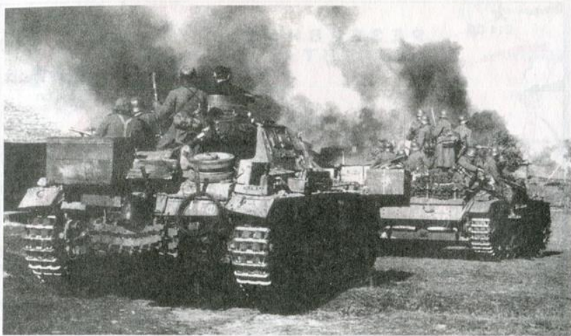
Танки и мотопехота 11-й танковой дивизии на марше. Октябрь 1941 года