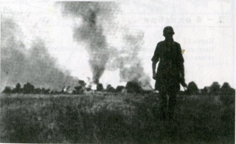
Горе и дым пожарищ принес на нашу землю гитлеровский завоеватель