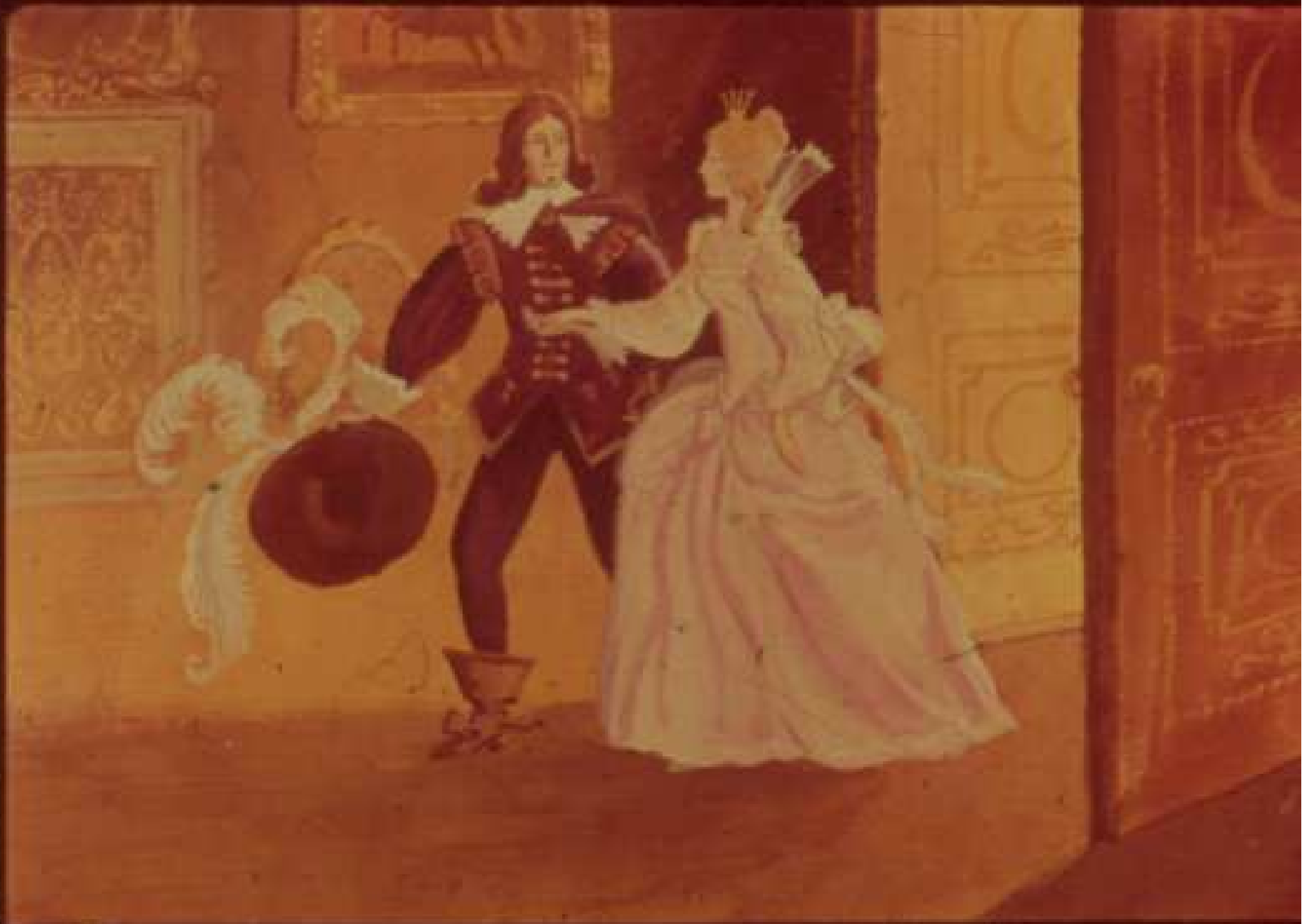
Принц подал руку своей невесте и повёл её в столовую. 44