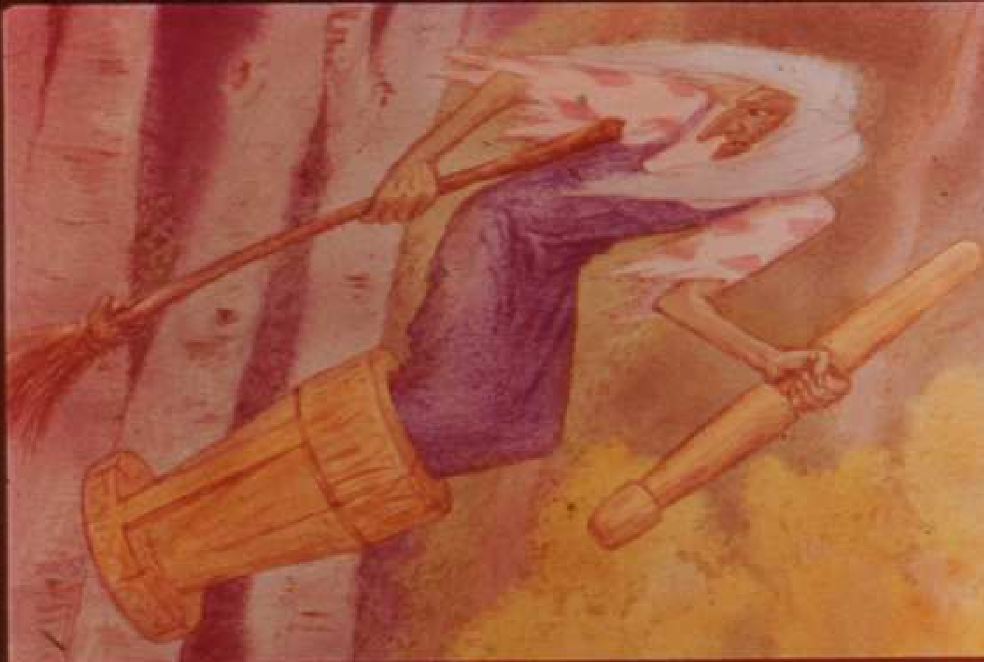
Села она в ступу, пустилась в погоню. Пестом погоняет, по- мелом след замечает.