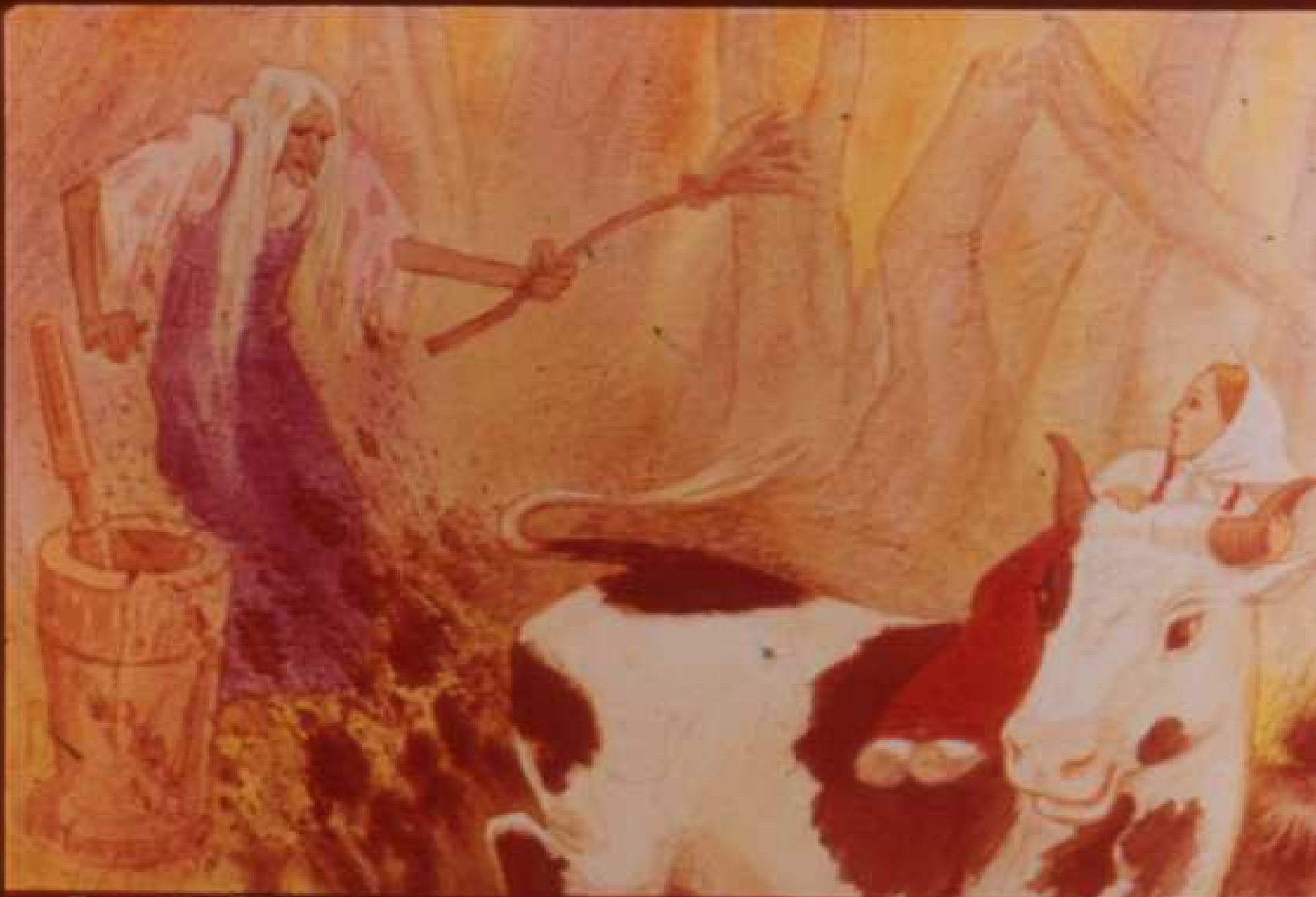
Только баба-яга подлетела да из ступы выскочила, бычок стал по болотцу задними ногами бить.